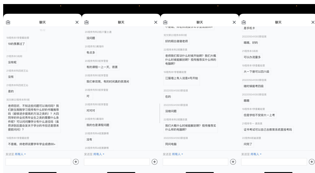
图3 同学们通过聊天框提问互动

此次座谈会同学们踊跃发言，针对多个班级反映的网速不好影响线上课顺利进行的问题雍院助及时与相关部门联系解决，根据学生反映的其他老师在教学中出现的问题，教研室会后及时联系相关教师解决、反馈，通过此次师生座谈会的交流，增进了师生的感情，也增加了师生之间的了解。对于同学们提出的意见，教师们后期会进行积极的完善和提高，坚持做到以学生为本，立德树人。